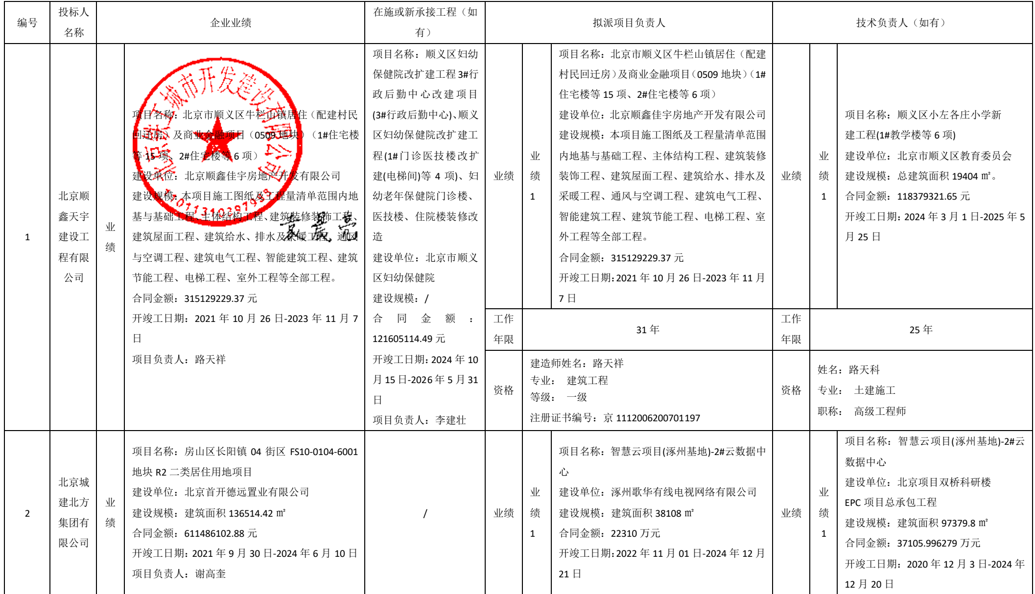
投标人商务信息公示表